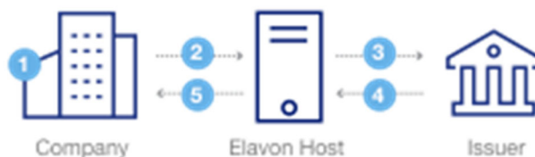
Figure 2-1. Processus d'Autorisation

Le schéma suivant représente le processus d'autorisation électronique :